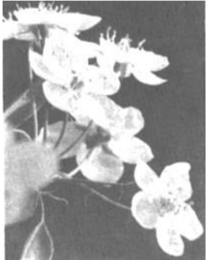
春风第一枝

当我们历经艰辛跋涉，终于站到泰山极顶时，不禁欢呼起来。一种胜利后的喜悦涌上心头，在料峭的风雪中，让人觉出温暖。有人诗兴大发：“啊，泰山，你终于跪伏在我们脚下了！”是啊，尽管山雾蒙蒙，看不清周围的一切，看不清泰山的秀丽风景，但我们感受到了，自己已把一切踏在脚下。这种感觉是无与伦比的。