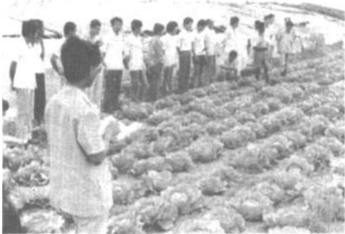
河口区总结推广六合乡梅家村大棚蔬菜生产经验，推动全区大棚蔬菜生产发展。图为六合乡领导在向参观人员介绍梅家村大棚蔬菜生产经验。